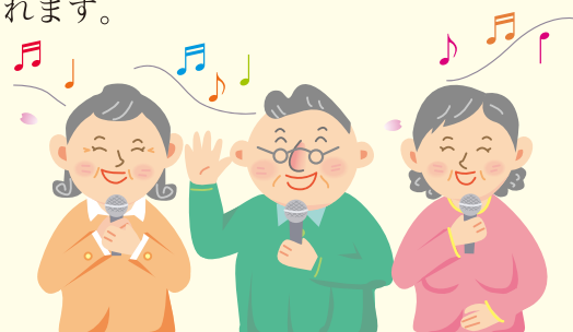
日本音楽著作権協会 カラオケ使用料早見表