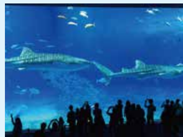
美ら海水族館のジンベエザメ