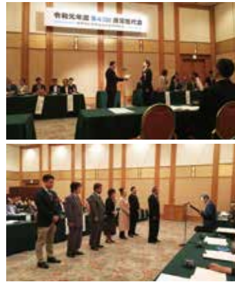
表彰を受ける皆さま