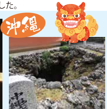
ひめゆりの塔 第三外科壕