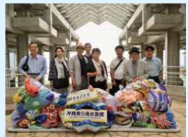
美ら海水族館の入口で