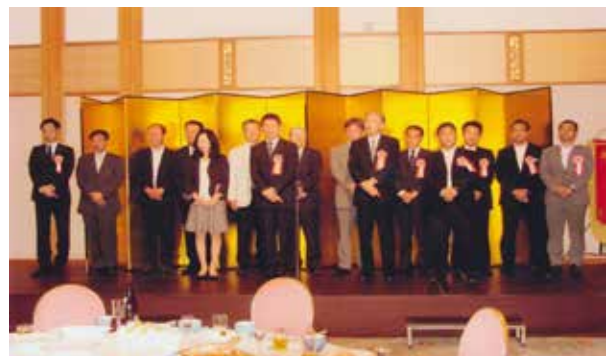
総代会が無事終了

平成28年6月7日(火)長野市 のTHE SAIHOKUKAN HOTELに於いて開催されま した。